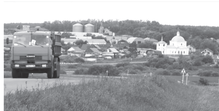
Кочнево - одно из самых живописных сел нашего округа