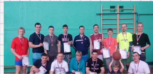
18.03.2018. Соревнования по волейболу