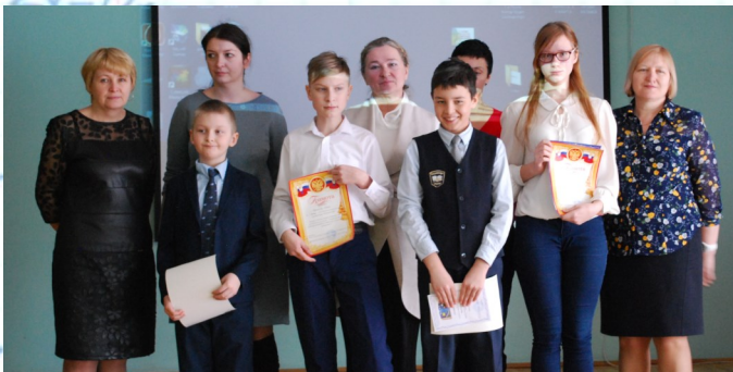
Победители НПК «Науке—виват!»