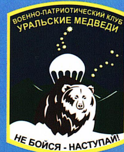
Автономная некоммерческая организация Военно- патриотический клуб "Уральские Медведи"